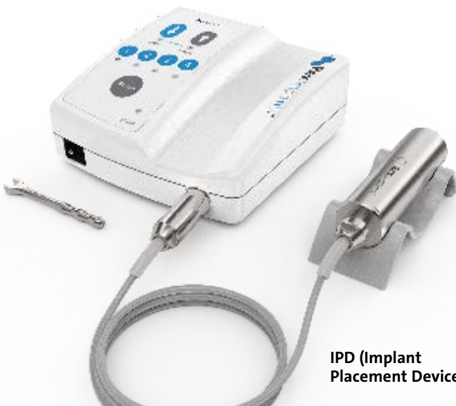
IPD (Implant Placement Device)